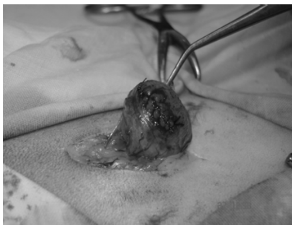
Рис. 2. Шовно-клеевое закрытие операционной раны мочевого пузыря у кошки