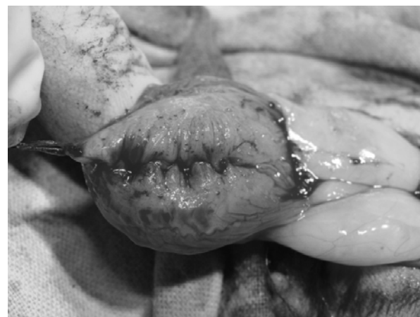
Рис. 3. Традиционный двухрядный шов, наложенный на операционную рану мочевого пузыря у кошки

Интраоперационно и в послеоперационный период проводили клинические, гематологические, гистологические, бактериологические, ультразвуковые исследования и пневмопрессию [5].