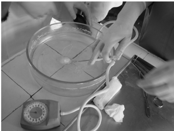
Рис. 4. Проведение пневмопрессии на патматериале

лено следующее. «Бесшовное» соединение тканей мочевого пузыря сразу после склеивания выдерживало давление 80-110 мм рт.ст. После выполнения шовно-клеевой композиции давление воздуха в мочевом пузыре довели до 100-120 мм рт.ст. При использовании традиционного двухрядного шва физическая герметичность изменялась в пределах 60 мм рт.ст.