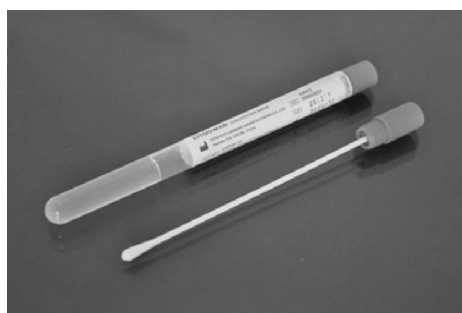
Рис. 2. Стерильный тампон с транспортной средой Amies

После забора материал помещали в пробирки с транспортной средой Amies и доставляли в микробиологическую лабораторию в течение 12-24 ч (рис. 2).