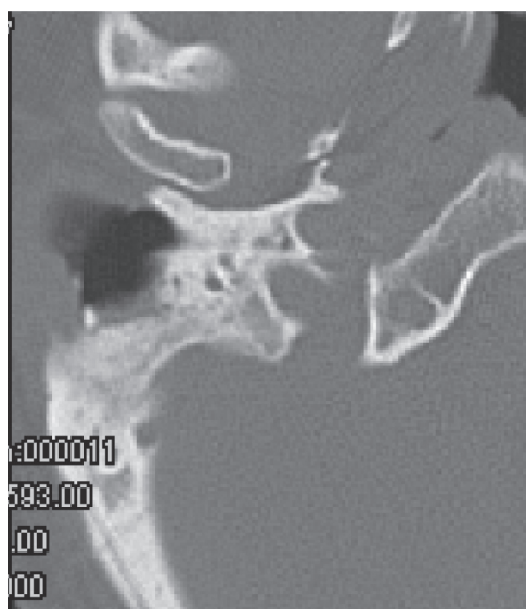
Рис. 1. Через 1 месяц после операции.